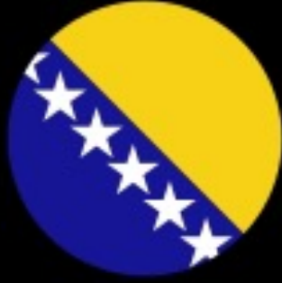
Bosnia + Herzegovina